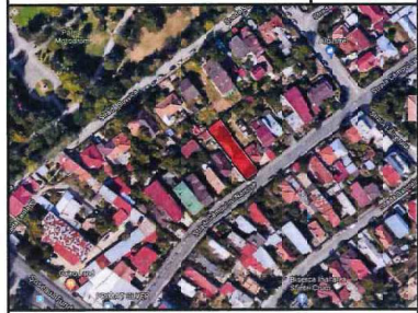
INVENTAR PUNCTE PE CONTUR