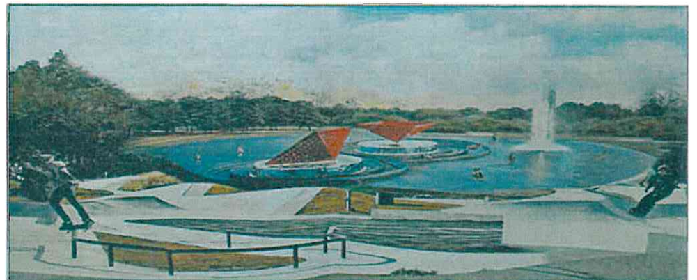
simulare ziua 1