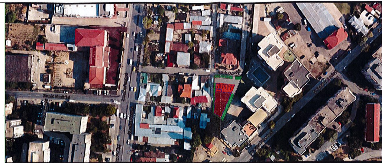
Schita plan sc. 1:2000 (imagine Google Maps)