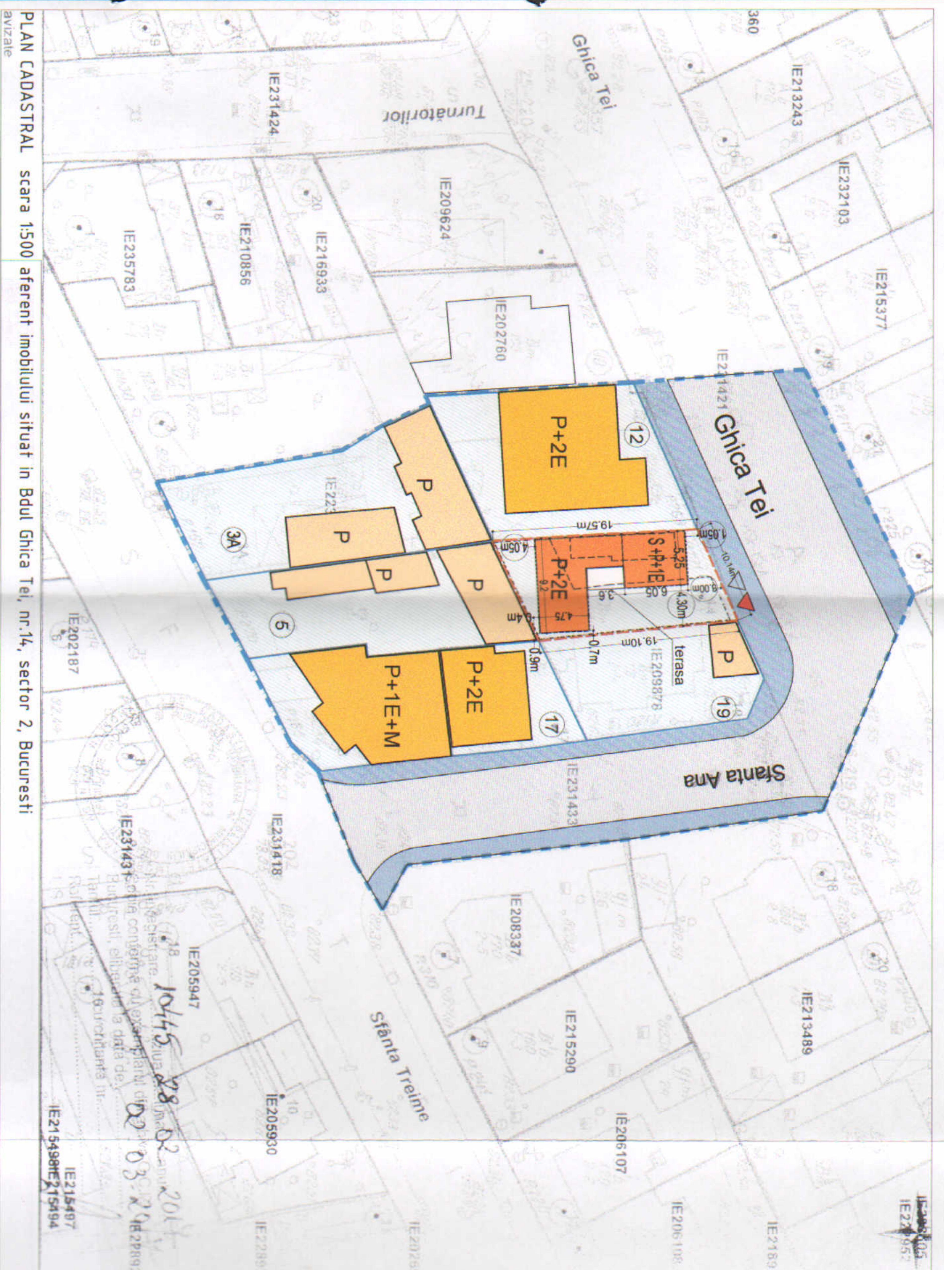
PLAN CADASTRAL scara 1:500 aferent imobilului situat in Bdul Ghica Tei, nr.14, sector 2, Bucuresti avizate