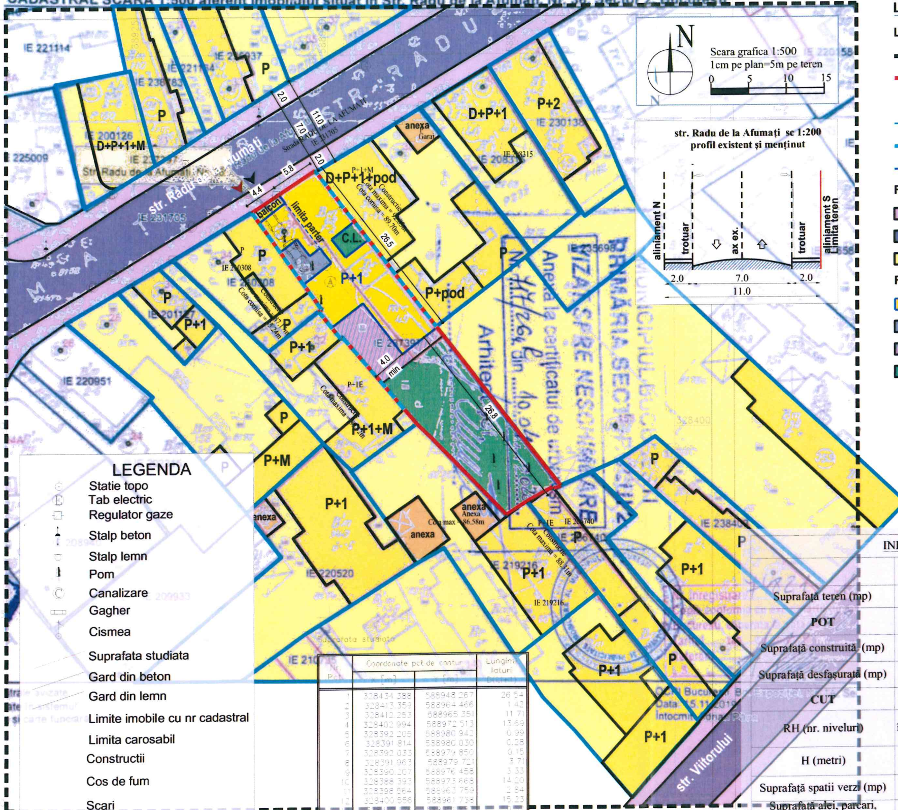
CADASTRAL SCARA 1:500 aferent imobilului situat in Str. Radu de la Afumați, Nr. 36, Sector 2, Bucuresti

Verificat Urb. E. Dinu URBAN ARTE STUDIO este singurul proprietar al proiectului si al continutului acestuia. Nu este permisa folosirea acestui proiect fara permisiunea scrisa a proiectantului si nu va fi folosit in alt scop decat cel pentru care a fost elaborat.