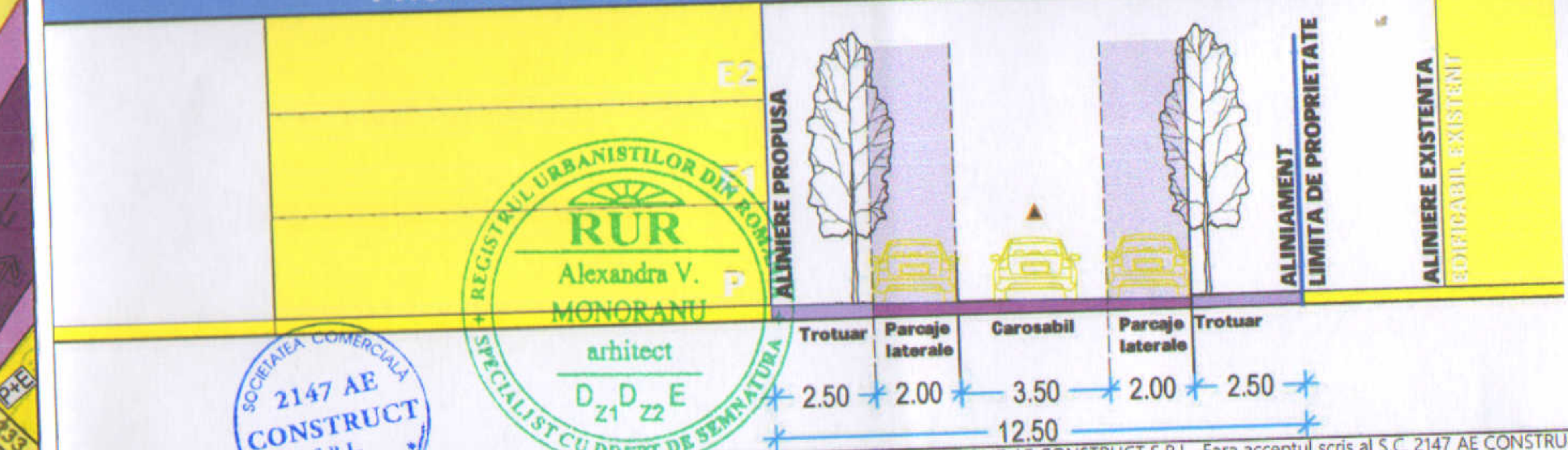
PROFIL A-A - STR. BARBAT VOIEVOD - scara 1:200

@COPYRIGHT: Prezentă planșa cu toate elementele și informațiile conexe este proprietatea intelectuală S.C. 2147 AE CONSTRUCT S.R.L. Fără acceptul scris al S.C. 2147 AE CONSTRUCT S.R.L., ea nu poate fi reprodusă, copiată, imprumutată sau refolosită în afara părții de proiect careia i se adresează. Beneficiarul va suporta material sau penal (după caz) consecințele nerespectării prevederilor legii privind drepturile de autor și drepturile conexe nr.8/1996.