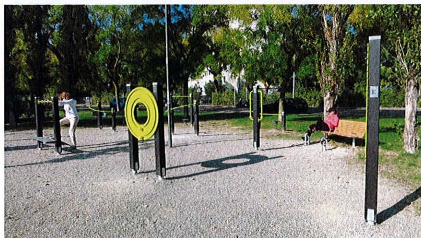
Bancă cu loc pentru baston