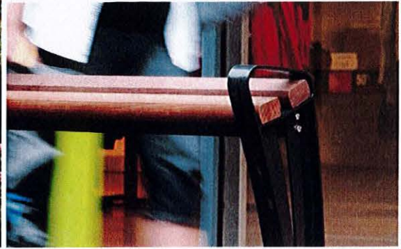
Bancă pentru gimnastică